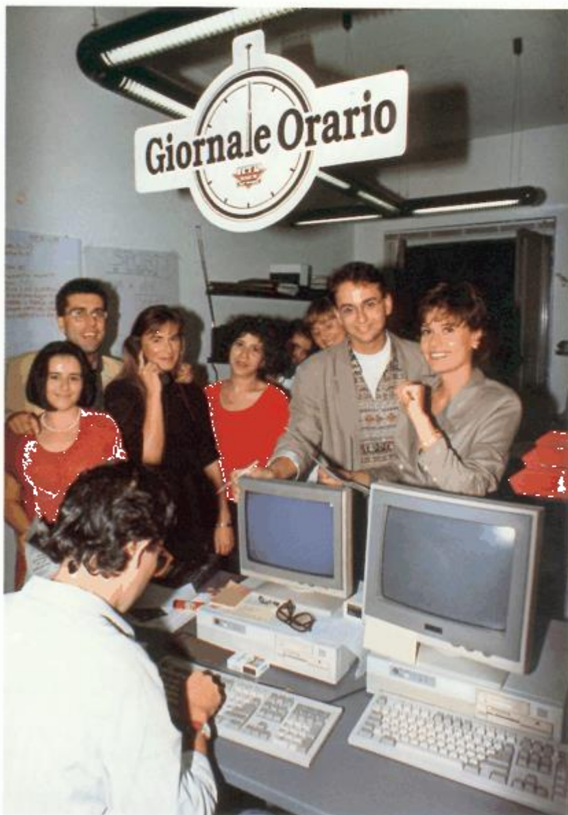
I giornalisti della redazione di RTL 102.5

T rentesimo Minuto è un breve spazio informativo che si colloca al 30° minuto di ogni ora, 24 ore su 24 sempre in diretta. Il suo scopo è quello di dare risalto a una sola notizia tra quelle già esposte nel Giornale Orario. L'approfondimento viene realizzato per l'interesse intrinseco dell'argomento o per l'attrattiva della notizia scelta. Il suo utilizzo informativo rimane comunque elastico e per questo applicabile alle diverse esigenze d'informazione che si pongono durante la giornata. Qualora accada un evento importante, questo può essere comunicato in tempo reale all'utenza proprio usufruendo di Trentesimo Minuto. Si mantiene così quella caratteristica di tempestività che è propria dell'informazione radiofonica.