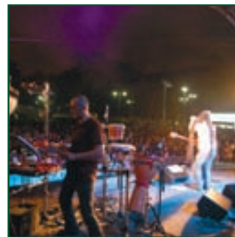
TALENTI PER NATURA 2008 15 aprile - 5 giugno Parco Sempio- ne Milano, serata apertura Festival Internazionale dell'Ambiente