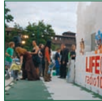
TALENTI PER NATURA 2007 Eco Park 5 giugno Parco Sempio- ne Milano serata apertura Festival Internazionale dell'Ambiente