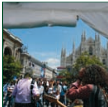
PIAZZA DUOMO, MILANO 2008 dal 6 all'11 giugno area relax Festival Internazionale dell'Ambiente