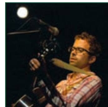
LA SALUMERIA DELLA MUSICA Jesse Harris