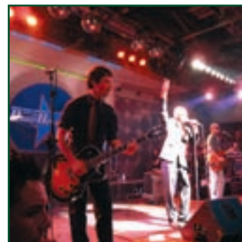
TALENTI PER NATURA 2007 22 novembre - 18 dicembre festa finale a Roma