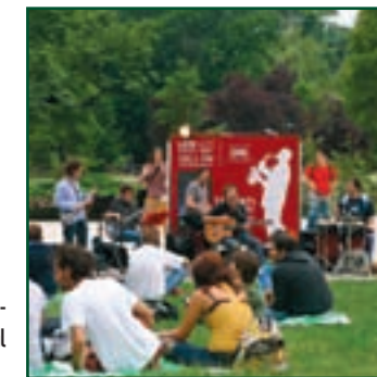
TALENTI PER NATURA 2007 Eco Park oasi musicali, Parco Sempione Milano, Festival Inter- nazionale dell'Ambiente